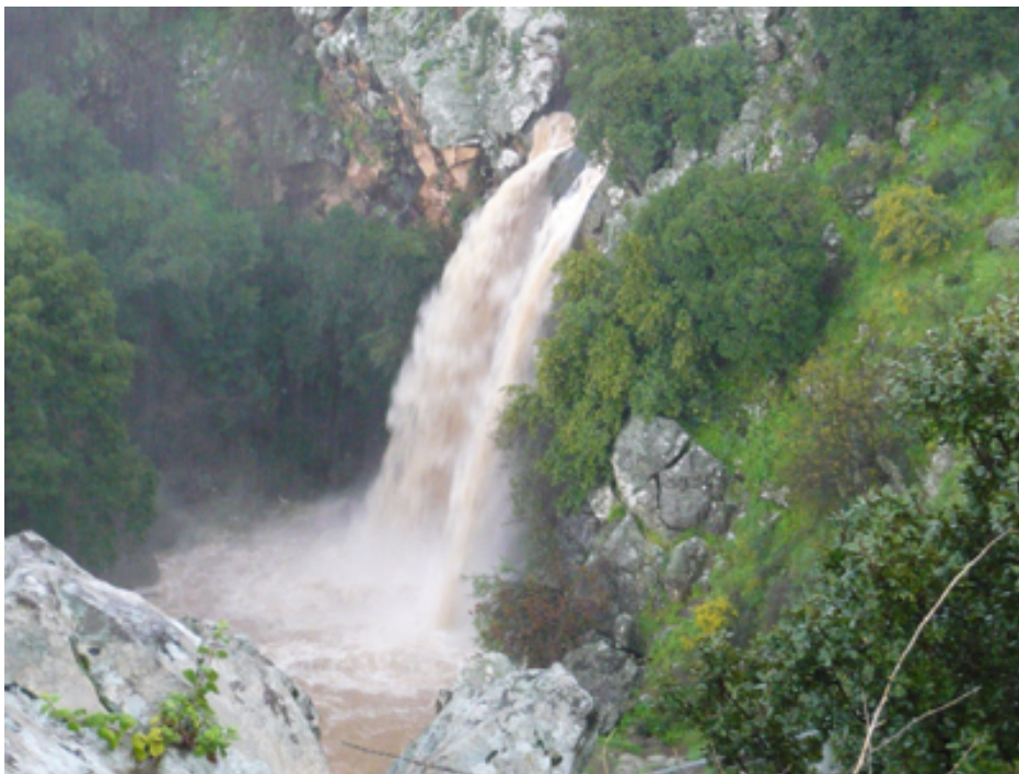
Thác nước trên cao nguyên Golan.

Golan có lịch sử lâu đời thời thánh kinh được ghi chép và nơi tìm ng&#225;ng v&#225;i nhiều di tích khảo cổ đáng chú ý cũng là địa điểm du lịch thu hút khách tham quan v&#225;i nhiều dòng suối, núi non và thác nước tuyệt đẹp.